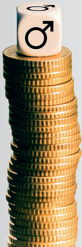
Verdienste von Frauen und Männern in der Elektro- und Metallindustrie, Deutschland 2022 Bruttostundenverdienst ■ mit Tarifbindung ■ ohne Tarifbindung

In Betrieben der Metall- und Elektroindustrie mit Tarifvertrag verdienen Frauen fast 11 Euro in der Stunde mehr als Frauen, die nicht von Tarifverträgen profitieren. Die Entgeltlücke zwischen Männern und Frauen fällt damit 9 Prozentpunkte geringer aus als in Unternehmen ohne Tarifvertrag.